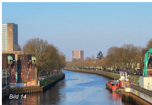
Bild 14: Der Abbruch der Cäcilienbrücke hat begonnen.

Seit Frühjahr 2025 ist die Cäcilienbrücke in Oldenburg endgültig Geschichte. Mit dem Abbruch der vier markanten Ecktürme wurde ihr Schicksal besiegelt. Das bewegliche Brückenelement war bereits lange Zeit zuvor ausgebaut worden, nun zeugen nur noch die Fundamente von ihrer Existenz. Sie war die jüngere von zwei Hubbrücken über