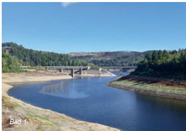
Bild 1: Niedriger Wasserstand der Okertalsperre im Harz infolge veränderter Niederschläge und Zuflüsse im Jahr 2025.

hauptsächlich in den Landkreisen Uelzen, Lüneburg und Lüchow-Dannenberg, Tendenz zunehmend (Statistisches Bundesamt 2024). Das phänologische Jahr (wiederkehrende Entwicklungserscheinungen in der Natur im Jahreslauf) wird länger, startet eher und hört später auf.