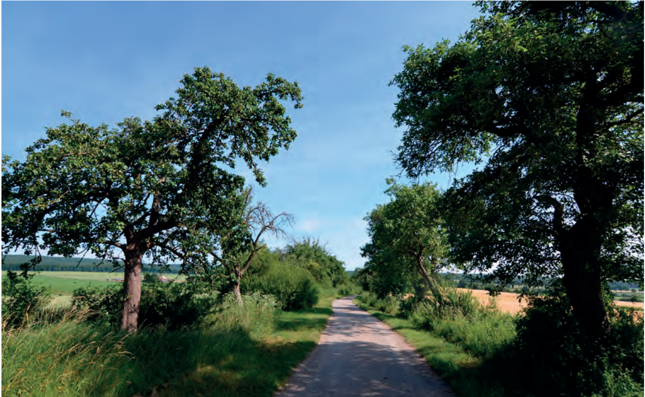
Abbildung 30: Positives Beispiel eines Weges im süd-niedersächsischen Bergland.