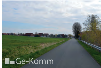
Abbildung 13: Ortsverbindung, Kategorie 1: Wenn Wege eine so hohe Verkehrsbedeutung zwischen Ortschaften/Siedlungen aufweisen, werden sie als Ortsverbindungen kategorisiert.

Bei der Bestandserfassung des Wegenetzes der WiN-Modellregion durch die Ge-Komm GmbH wurde die aktuelle Situation hinsichtlich der Befestigung und des Zustandes der Wege erfasst. Diese Erfassung war Grundlage für eine konzeptionelle Betrachtung, bei der die Wege in sechs verschiedene Kategorien eingeteilt wurden, die in den Abbildungen 13–18 veranschaulicht sind.