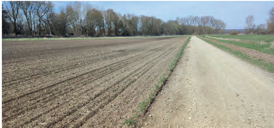
Abbildung 6: Wegraine können zum Teil um mehrere Meter überackert sein, so dass sie ihre ökologischen Funktionen nicht mehr erfüllen können.

Vergessenheit geraten. Werden Wegränder aber mit in die landwirtschaftliche Nutzung genommen, können sich dort keine langfristigen, artenreichen Strukturen entwickeln. Daher sind Überackerungen anhand der ALKIS-Daten zu identifizieren und im Konsens (!) dem ursprünglichen Wegekörper wieder hinzuzufügen.