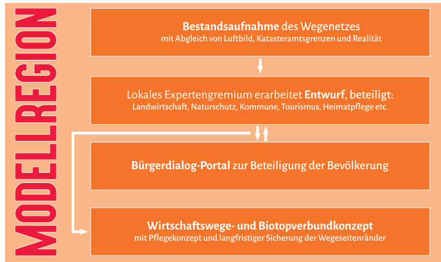
Abbildung 12: Übertragbarer Ablauf zur Erstellung eines Wirtschaftswege- und Biotopverbundkonzepts wie in der Stadt Rehburg-Loccum und der Gemeinde Schiffdorf (Grafik: NHB).

Ein Wirtschaftswege- und Biotopverbundkonzept (WBK) wird entwickelt, um für alle Stakeholder am Wegenetz tragbare Lösungsansätze zu entwickeln (Abb. 12). Der im Folgendenvorgestellte allgemeine Konzeptteil über Wirtschaftswege kann genutzt werden, um den Handlungsbedarf für den Unterhalt der Wirtschaftswege möglichst langfristig und effizient zu gestalten und die kommunalen Außenbereiche nachhaltig zu stärken. Das Biotopverbundkonzept zeigt dafür jeweils diejenigen Wegraine auf, die für eine Biotopvernetzung bedeutsam sind, und gibt Informationen zur weiteren fachgerechten Pflege von Wegrainen, letztlich aber auch Hinweise für den fachgerechten Wegeunterhalt.