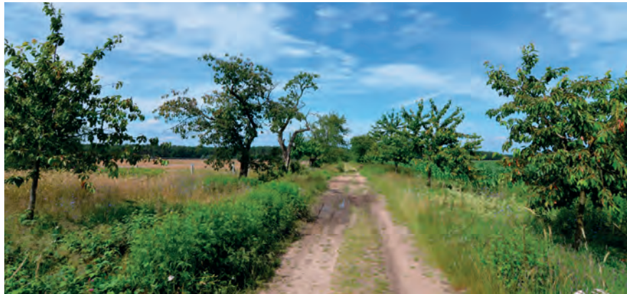
Abbildung 11: Positivbeispiel aus dem Landkreis Lüchow-Dannenberg.

lem überwinternde Arten und früh aktive Insekten am Beginn des Lebenszyklus betroffen. Wegrandpflege, zu gestaffelten Zeitpunkten und in verschiedene Abschnitte unterteilt, ist daher am besten geeignet, um die Vielfalt von Pflanzen und Tieren, auch unter der Berücksichtigung von Verlusten, zu erhalten.