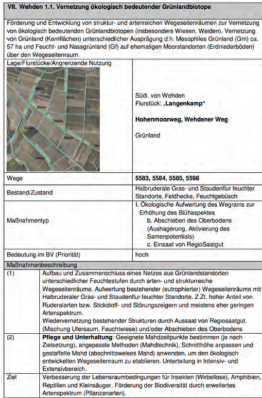
Abbildung 22: Maßnahmebeschreibung für Wegeabschnitte in Wehden, Gemeinde Schiffdorf (U.Hesse/NHB).