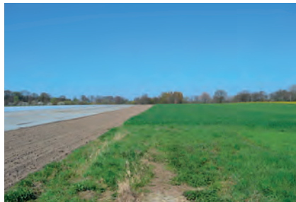
Abbildung 18: Kategorie 6, Optionswege: Hier handelt es sich um Wegeparzellen, die in der Örtlichkeit nicht mehr als Weg vorhanden sind oder nicht mehr als solcher genutzt werden.