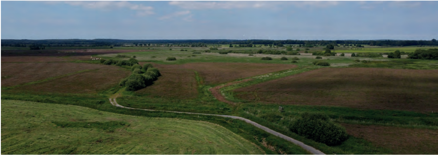
Abbildung 5: Ein Biotopverbund vernetzt verschiedene Lebensräume miteinander und ermöglicht Mobilität der Flora und Fauna (Quelle: L. Daniel/NHB).

Verbindungskorridore zwischen Biotopen entschärfen. Wegseitenräume erfüllen neben der Erhöhung der Biodiversität und der Lebensraumvernetzung noch weitere wichtige ökologische Funktionen. Bewachsene Wege schützen den Boden vor Erosion und erhalten somit die Bodenfruchtbarkeit (Seutloali, 2018).