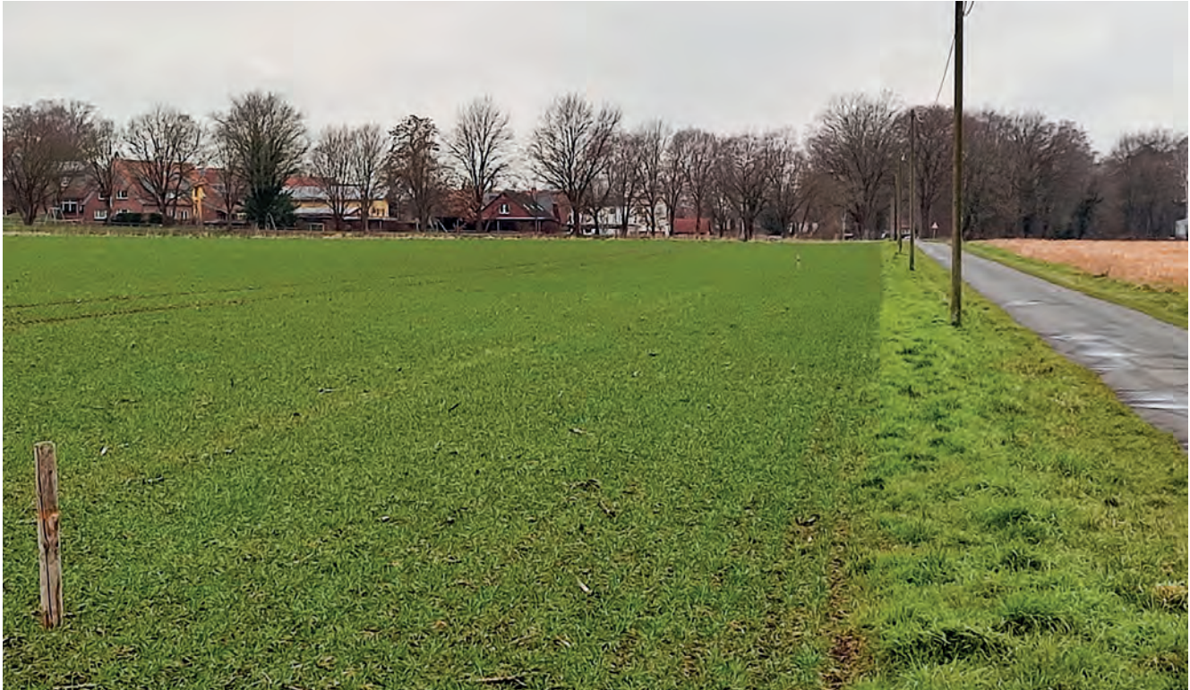
Abbildung 28: Wegraine sind nicht selten mehrere Meter überackert. Der Holzpfosten links markiert die Flurstücksgrenze. Der mehrere Meter breite Streifen zwischen Pfosten und Wegrain ist somit überackert.