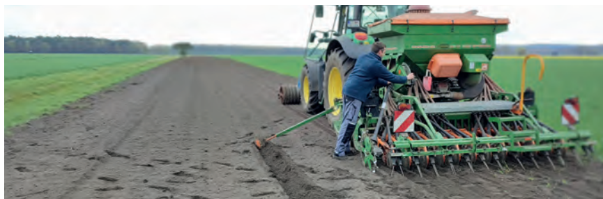
Abbildung 25: Aussaat auf der Pilotfläche 1 neben einem Wald- und Wiesenweg durch den anliegenden Landwirt (NHB).

Die weiteren vier Pilotflächen wurden im Frühjahr 2023 vom NHB-Team ausgemes-sen; die Vorbereitung der Flächen sowie die Einsaat und weitere Maßnahmen da-rauf sollen noch im selben Jahr von dem Landwirt bzw. einem geeigneten Unter-nehmer durchgeführt werden.