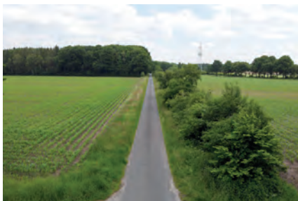
Abbildung 29: Breite, blüten- und strukturreiche Wegraine werten das Landschaftsbild auf und vernetzen Lebensräume.

Verzögerungen im Projektverlauf führen. Nehmen Kommunen sich eine Wegrain-Revitalisierung im Gemeindegebiet vor, sollten zeitliche und personelle Ressourcen vorhanden sein, um tatsächlich ins Handeln zu kommen. Die Kosten, die für die Umsetzung eines solchen Konzepts anfallen, müssen im kommunalen Haushalt budgetiert oder mithilfe von externen Fördergeldern finanziert werden.