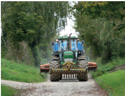
Abbildung 4: Platzprobleme (Quelle R. Olomski/NHB).

Wege, gemeint sind hier die unklassifizierten Landwirtschaftswege in einer Feldmark, können aus verschiedenen Blickwinkeln betrachtet werden. Sie haben sowohl eine ökonomische als auch eine ökologische Bedeutung, wodurch unterschiedliche Prioritäten für Ausgestaltung, Instandhaltung und Pflege gesetzt werden.