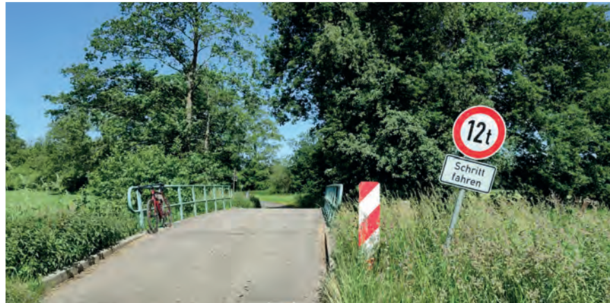
Abbildung 1: Heute sind geringe Traglasten von Brücken ein großes Kostenproblem im ländlichen Wegebau.

Werkzeug des Wege-Biotop-Verbundkonzept auf andere Regionen Niedersachsens übertrag- und anwendbare Konzepte und Handlungsempfehlungen vorschlägt.