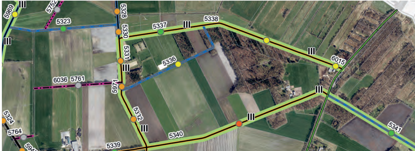
Abbildung 21: Ausschnitt aus dem fertigen Wege- und Biotopverbundkonzept. Die Wegekategorie, der Wegezustand, die Befestigungskategorie und die Wege, welche sich besonders für den Biotopverbund anbieten, werden grafisch dargestellt.