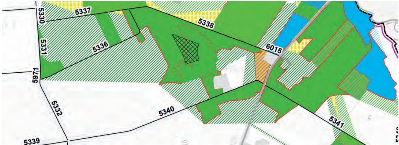
Abbildung 20: Um die Wege, welche für den Biotopverbund besonders relevant sind zu lokalisieren, wurden um Kern- und Trittsteinbiotope Suchräume gezogen.