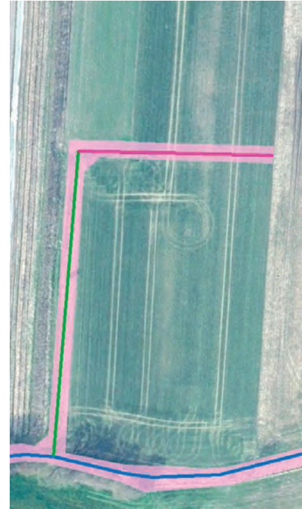
Abbildung 18a: Luftaufnahme des Optionswegs.