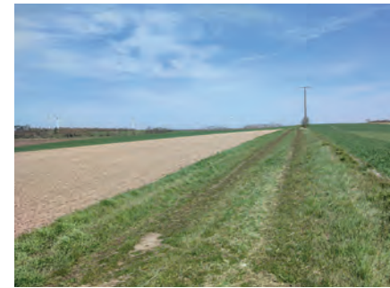
Abbildung 9: Artenarmer Wegrand.