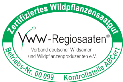
Abbildung 10: Der Verband deutscher Wildsamen- und Wildpflanzenproduzenten hat ein Zertifikat entwickelt, mit dem garantiert wird, dass Herkunftsgebiete des Saatguts jeweils regional angepasst sind.