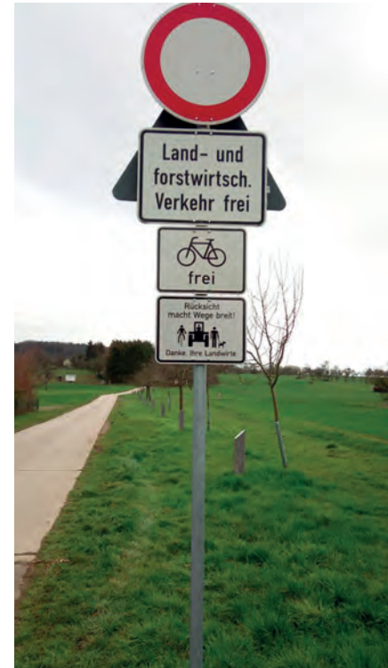
Abbildung 2: Ländliche Wege sind für alle Menschen da.