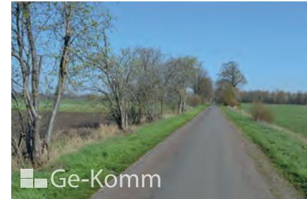
Abbildung 14: Hauptwirtschaftsweg, Kategorie 2: Neben der Erschließung von Grundstücken dienen Hauptwirtschaftswegen dem Verkehr innerhalb der Außenbereiche; sie haben eine wichtige Verkehrsbedeutung und bilden das Kernwegenetz der ländlichen Räume, auf das sich der landwirtschaftliche (Schwer-)Verkehr konzentriert.