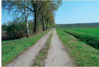
Abbildung 16: Kategorie 4, Untergeordneter Wirtschaftsweg: Ein Weg gilt dann als untergeordneter Wirtschaftsweg, wenn er der Erschließung und Anbindung einzelner Grundstücke dient und dabei überwiegend für den land- und forstwirtschaftlichen Verkehr von Bedeutung ist.