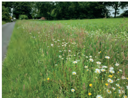
Abbildung 8: Blütenreicher Wegrand.

Revitalisierung in der Gemarkung vorhanden ist. Jahrelange intensive Wegrandpflege kann den Pflanzenbestand in der Gemarkung derart dezimiert haben, dass sich ein blütenreicher Wegrain aus eigener Kraft kaum noch entwickeln kann (Kirmer et al., 2019). Gezielte Maßnahmen können artenreiche und lebendige Wegraine wieder herstellen. Mittels Abschieben des Oberbodens können nährstoffreiche Standorte ausgehagert werden (StMUV, 2020), wodurch der bestehende, z.B. durch Mulchen mit monotonem Gras- und Wildkräuterbestand massiv gestörte Standort vorbereitet wird, damit die im