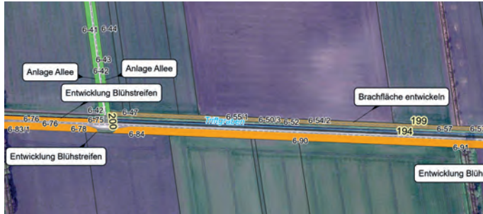
Abbildung 24: Ausschnitt aus der Karte zum Revitalisierungskonzept Wolfenbüttel (NHB).

den Gesprächen und den Wegeschauen können nun lokale Akteure an der Umsetzung von Revitalisierungsmaßnahmen weiterarbeiten.