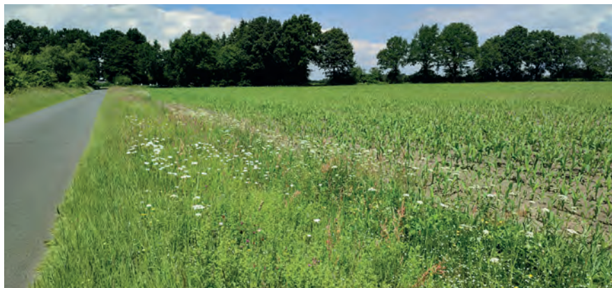
Abbildung 19: Ein arten- und struktureicher Wegrain mit großem Potenzial für Naturschutz und Biotopverbund. Hier wurde auf einer Wegrainseite regionales Saatgut ausgesät.

Warum ein online Bürgerdialogportal? Ein digitales Beteiligungs-Portal gibt umfassende Auskunft und ermöglicht eine Einsicht und Kommentierung rund um die Uhr. So können sich Bürgerinnen und Bürger unabhängig von Öffnungszeiten und festen Terminen informieren und beteiligen.