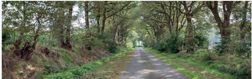
Abbildung 23: Die Wälle der Wallhecken in Schiffdorf sind meist nur noch schwer erkennbar.

der UNB. Auch durchwachsende Wallhecken – sogenannte Baumhecken – haben einen Wert für den Naturschutz und das Landschaftsbild. Bezüglich des Biotopverbunds gilt die Frage nach der Förderung der zu vernetzenden Zielarten, denn sowohl Hecken als auch Baumreihen sind Habitate für unterschiedliche Arten. Daher sollten die Zielarten möglichst genau definiert und daran Pflege- und Gestaltungsmaßnahmen angepasst werden. „Klassische“ Wallhecken sollten aber in jeder Gemeinde mit Wallheckenbeständen als Kulturbiotope mit einem Anteil von mind. 10-20 % des Gesamtbestands repräsentiert sein und erhalten bleiben (Schupp & Dahl, 1992).