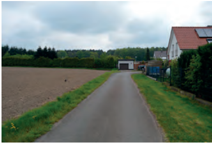
Abbildung 15: Kategorie 3, Anliegerwirtschaftsweg: Diese Wege werden auch als Nebenwirtschaftsweg bezeichnet. Sie weisen Vernetzungs- und Anbindungsfunktion ohne starke Verkehrsbedeutung auf und erschließen in der Regel private Grundstücke.