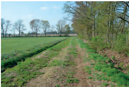
Abbildung 17: Kategorie 5, Unbefestigter Wald- und Wiesenweg: Wald- und Wiesenwege haben in der Regel keinerlei Verkehrsbedeutung.