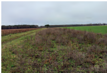
Abbildung 26: Pilotfläche 1 im Frühjahr 2023, ein Jahr nach Aussaat.

den Größenordnung. Solange es keine ausgereifte Technik für kommunale Bauhöfe gibt, muss sich hier – abgesehen von den zu budgetierenden Finanzmitteln und Zeitbudgets – um die künftige Pflege durch Dritte bemüht werden.